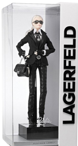
Karl Lagerfeld Barbie (2014)

Sinds de introductie op de speelgoedbeurs in New York in 1959 zijn er al meer dan 1 miljard Barbies verkocht in meer dan 150 landen. Ze heeft in totaal meer dan 200 verschillende beroepen uitgeoefend. Al 60 jaar volgt Barbie de wispelturige modewereld, terwijl ze een bestseller van de speelgoedwinkel blijft. Dit wereldwijd icoon is niet bang van controverses. Ze blijft innoveren en met haar tijd meegaan.