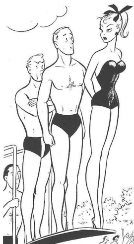
Cartoon Bild Lilli

De stijl in Barbie's kleerkast evolueert met de tijd mee, van de klassieke Jackie Kennedy stijl naar de kleurrijke en jeugdige 'Mod' stijl met minirok aan het einde van de jaren 1960.