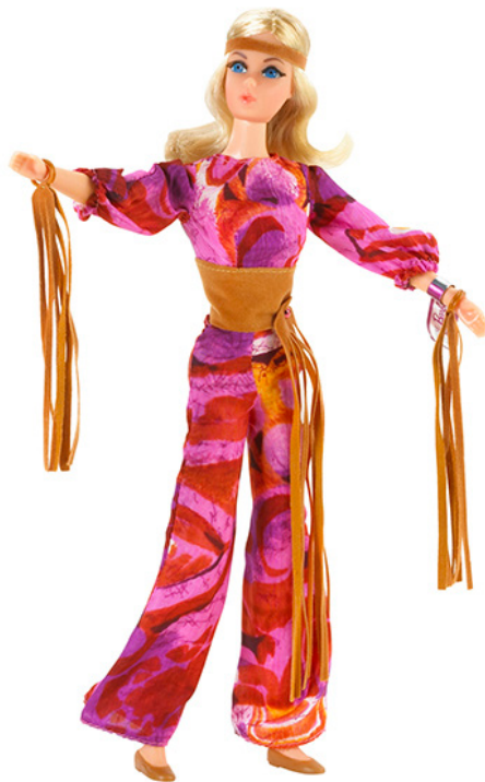
Live action Barbie (1971)

Aan het einde van de jaren 1970, in volle disco periode, komen verschillende Supersize Barbies op de markt en verschijnt Superstar Barbie. Met haar lang blond golvend haar lijkt ze sprekend op Farrah Fawcett, de tv-ster uit Charlie's Angels. Er is opnieuw plaats voor glitter en glamour.