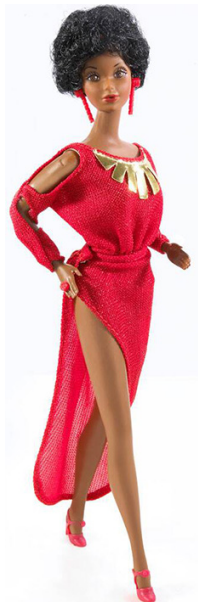
De eerste zwarte Barbie (1980)

De uiteenlopende thema's bevestigen de reclameslogan "We Girls Can Do Anything, Right, Barbie?".