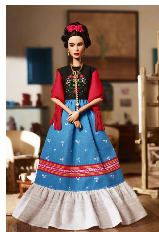
Frida Kahlo (2018)