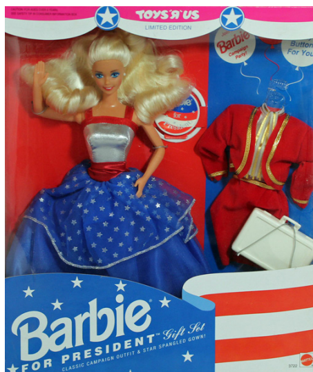
Barbie for President (1991)

Collectors reeksen die aan het einde van de jaren 1980 starten, worden verdergezet. Modeontwerpers als Bob Mackie, Vera Wang en Oscar de la Renta creëren spectaculaire jurken voor Barbie. Tijdens de kerstdagen wordt er elk jaar een speciale Happy Holiday Barbie op de markt gebracht.