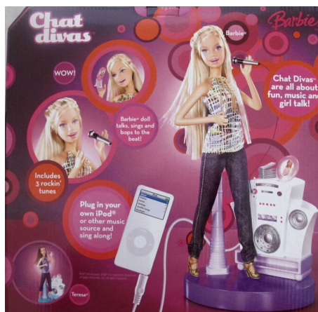
Chat divas Barbie (2006)

De silkstone poppen, die in 2000 geïntroduceerd worden, stralen een vleugje vintage uit en zijn gemaakt uit een zeer harde soort plastic, die op porselein lijkt.