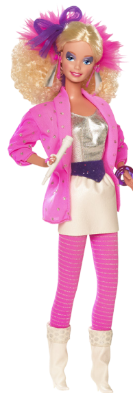
Barbie and The Rockers (1986)

The Barbie logo, featuring the word "Barbie" in a stylized, pink, cursive font with a registered trademark symbol.