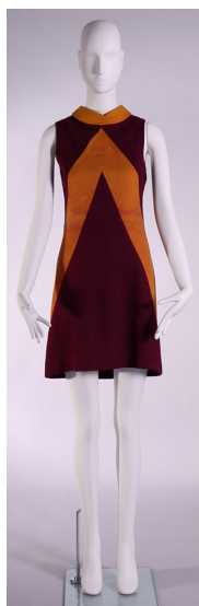
Jurk in paarse synthetische stof met oliegele kraag en omgekeerde V-vorm (1960)

Ook creaties van designers met Limburgse roots en een internationale uitstraling zoals Martin Margiela en Raf Simons worden actief verzameld. Een vaste opstelling heeft het museum niet. De eigen collectie komt aan bod tijdens de tijdelijke tentoonstellingen.